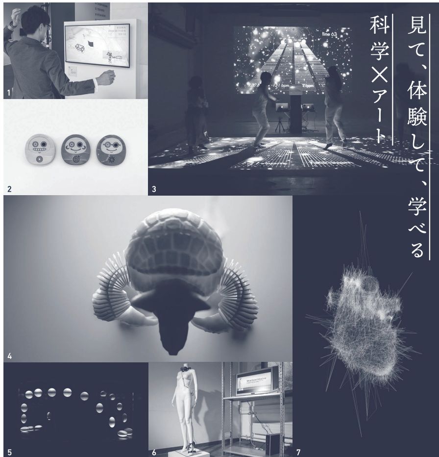
| 展示作品(一部) | 1. 勝部里菜・中澤満・益子宗・内山俊朗《engawa》/ 2. 櫻井亮汰・内山俊朗《Darumail》 3. 勝部里菜・牟田将史・益子宗・内山俊朗《heartbeat》/ 4. 岩船美友・大嶋泰介・落合陽一《Coded Skeleton》5. 鈴木健太《Schnellraumseher》/ 6. 杉本実夏《Walkaholic 2》/ 7. Pascal Haudressy《Heart》