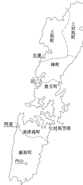
図1 研究対象地(長崎県対馬市。下線は調査地域)

以上より、せんだんごに関する文化的景観の理解は、対馬の食文化の保全・活用および地域活性化に向けた重要な視座を提供すると結論づけた。