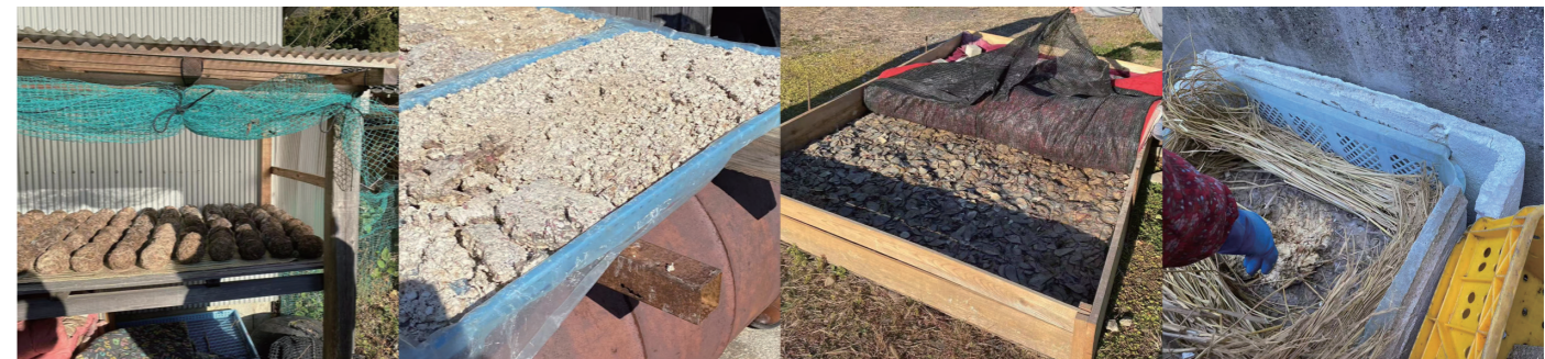
図4 せんだんごを発酵・乾燥している様子(現地調査で筆者撮影)