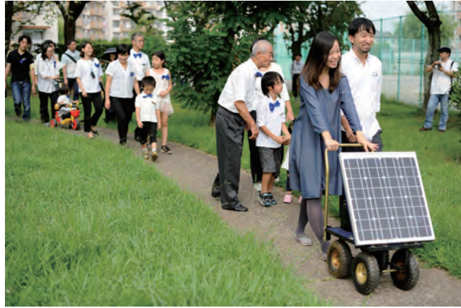
03 - 「サンセルフホテル」ゲストとホテルマンで太陽の光を集める蓄電散歩