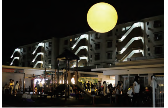
04 - 「サンセルフホテル」ゲストが来る日だけ、井野団地の広場に夜の太陽が昇る