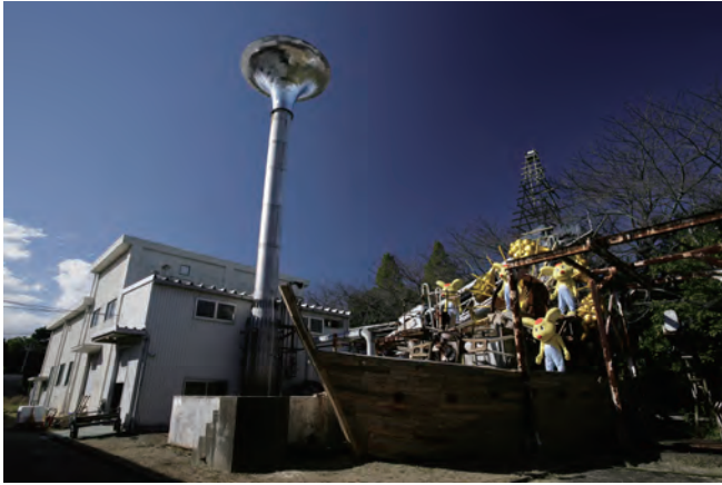
01 - 公募展「TAP2006 一人前のいたずら ー 仕掛けられた取手」元汚水処理施設での展示風景