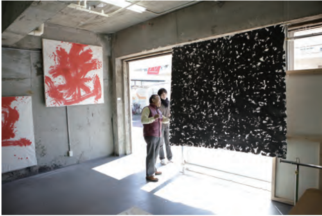
02 - オープンスタジオ「TAP2009 TAP トラベル産直とれたてアート」アトリエ風景