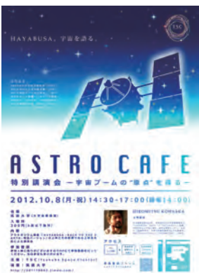
《ASTRO CAFE》2012 年 ポスター