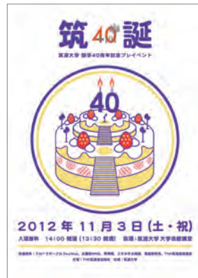
《筑誕》2012 年 ポスター