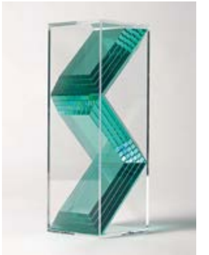
速水 一樹《boxed-in crystal》2017年 紙、アクリルケース