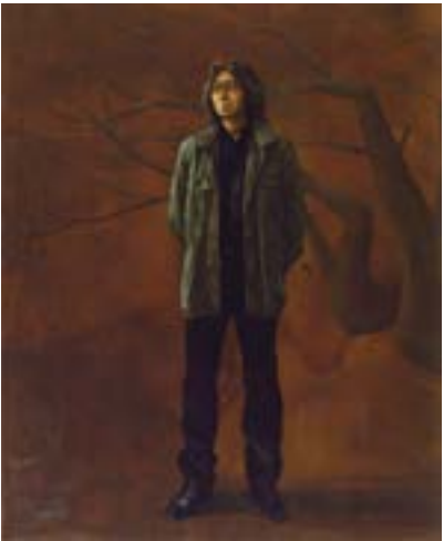
《立てる自画像》2006年、キャンバスに油彩、227.3 x 181.8 cm