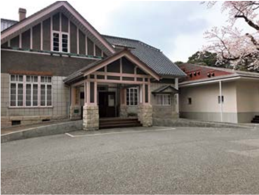
石川県文化財保存修復工房のある広坂別館

一つは、保存修復の普及活動を精力的に行っている二館を対象とした、取り組みの状況の参与観察と担当学芸員へのインタビュー調査である。インタビュー調査では、各館でこれまでに行われた保存修復に関する事例について、狙いや工夫点・来館者の反応・成果と課題などを尋ねた。兵庫県立美術館の学芸員からは、近現代美術の保存修復特有の問題を来館者へどのように伝えるかについて、石川県立美術館の学芸員