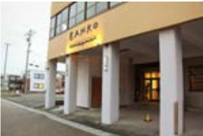
BANKO archive design museum 外観（筆者撮影）

全体を通して萬古焼の特徴として挙げられるのは、作り手は常に自身の利益を求めるのではなく、萬古焼全体の展望を考え、焼き物づくりや市場展開を行っており、そのためには新たな文化や技術を取り込むことに抵抗がないという点である。耐熱性という大きな特徴は、このような傾向から生まれ、また現在の製造においても、共同して展開していく点が強くみられる。支援活動をおこなっている三者に共通しているのは、萬古焼を大衆に浸透させていくためには、その製造工程や歴史的背景など文化として