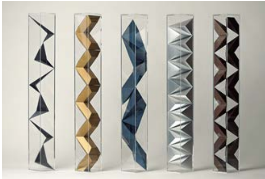
速水 一樹《boxed-in blocks vol.1》2017年 紙、アクリルケース 72 x 8 x 8cm

《うつろ》は、ストーリーを描くことでその抽象的な全体像を与え、鑑賞者を刻々と変化する光景の中に置くことで効果的に心情を見せ、印象を観客の中に残した。時間、身体、空間など多岐にわたる要素の手綱を握り、《うつろ》という題材を表現してみせたその構成力に私は惹