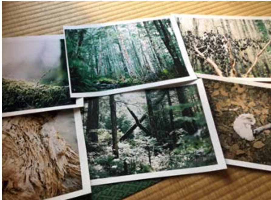
師匠に選ばれた6枚の写真