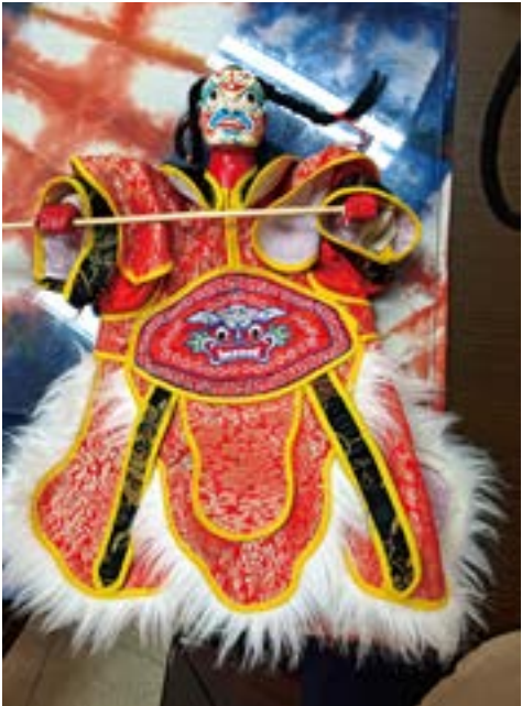
図1 伝統衣装を着た指人形、布袋戲（bu dai xi）〔台湾2018.5.15. 〕

「東洋」に分類される東アジアの国々の中から、日本の隣国の中国の成都ヴァルドルフ学校（Waldorf School Chengdu）、台湾の慈心ヴァルドルフ学校（CiXin Waldorf School）と、韓国の童林自由学校（Dongrim Freeschool）プルンスプ・ヴァルドルフ学校（Purunsup Waldorf School）における造形教育を取りあげ検討した。