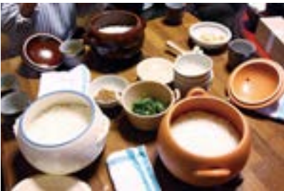
くまののワークショップ「土鍋 de 朝ごはん」の様子

の価値を提示し伝えていく必要があると考えている点である。窯元や問屋の視点からのみでは使用者のリアルな萬古焼への認識はつかめないが、逆に外部、即ち窯元や問屋以外からの視点のみでは窯元同士の関係性や詳細な萬古焼の歩みに踏み込めない。支援活動においても、外部の視点や意見を拒まない柔軟な受け入れと、窯元同士だけではない、様々な個人および団体との協力体制の持続が今後の展開では重要になるだろう。