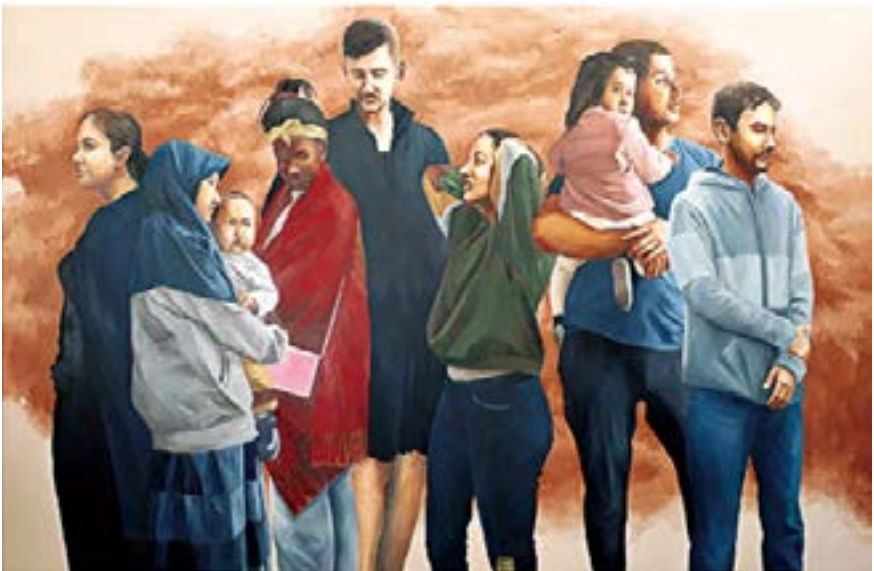
《TSUKUBA》2019年、板に油彩、(上) 145.5 x 227.3 cm (下) 145.5 x 227.3 cm