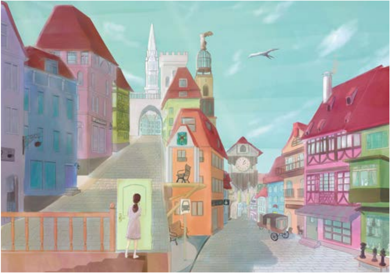
ナツグ《トタントトン》2018 CLIP STUDIO PAINT

ナツグ そういったSNSを見ていると、イラストの方が音楽よりも作り手にとっても受け手にとってもハードルが低いように感じています。自分で曲を発表したときに、絵のクオリティと曲のクオリティは同じくらいの質を担保していると思っているのですが、実際に、ニコニコ動画やpixivに投稿してみると、pixivの方が閲覧数や「いいね」の数が圧倒的に多かったことが