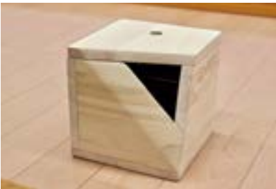
佐々木 鏡花 《無題》（2018）

また、作品だけでなく、コーネル自身の背景にもとても影響を受けました。コーネルは不遇の人で、小児麻痺の弟の介護に追われて、母とは毎日口喧嘩をしながら生涯を過ごしたそうです。そんな彼が、現実逃避の場として、こんなに豊かな精神世界をもっている。私なりの解釈になってしまうけれど、作品を通じてそれを