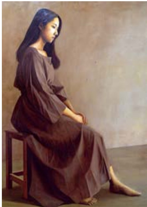
《午後の肖像》2018年、キャンバスに油彩、162 x 130.3 cm

そして油彩のもつその変わりやすい性質と表現の幅広さからか、絵は描いていくうちに刻一刻とその姿を変えていく。人物を描くにあたっては、形の整い具合や肌の質感などから人の存在感を表現するため、ことあるごとに次の筆運びを考える。だから制作中の絵と作者との相互のやり取りは、おのずとやらざるを得ないのだ。それゆえ兒玉さんは描き始める時に完成形の理想像はあまり思い描かないが、自分の本当