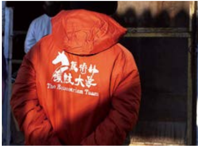
伴 聖菜 字：佐藤 汰一 《馬術部ウインドブレーカーデザイン》(2017)