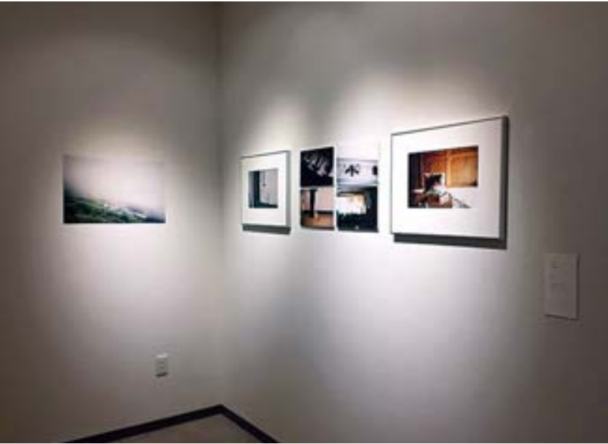
グループ展 S.D.L 《郷の断想》展示風景、2018年、galleryY

愛さんの話を聞いていると、このような独特の温かみやボケ感などはフィルムカメラ全体に見られる特徴のようだった。 「私はもしかしたら、フィルムカメラだったら絶対に出るこの雰囲気には酔っていたのかもしれない」 父の仕事で使っていたお下りのカメラ