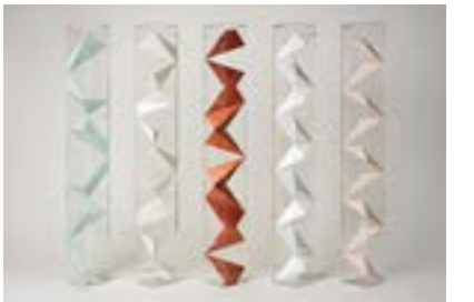
速水 一樹《boxed-in blocks vol.2》2018年 紙、アクリルケース