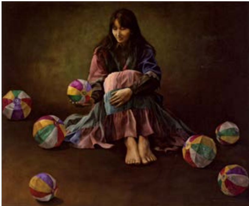
《想いを紡ぐ》2007年、キャンバスに油彩、145.5 x 296.1 cm、第47回画廊展 東京都知事賞