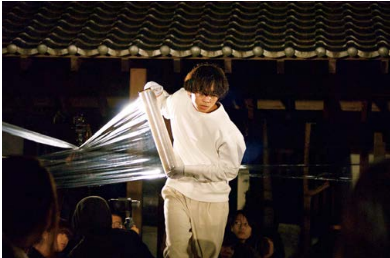
《うつろ》より 会場に梱包用ラップを張り巡らせているシーン。

突然、闇に浮かぶ白い線の交差が震えだす。彼と彼のための巣を取り巻く建物の壁を、どんどんと外から叩くような音が立ち始めた。飛び起きて怯える彼をよそに音は網のように全体へと広がり、会場全体が鳴っている。彼は決心したようにカッターナイフを取り出すと刃を繰り出し、