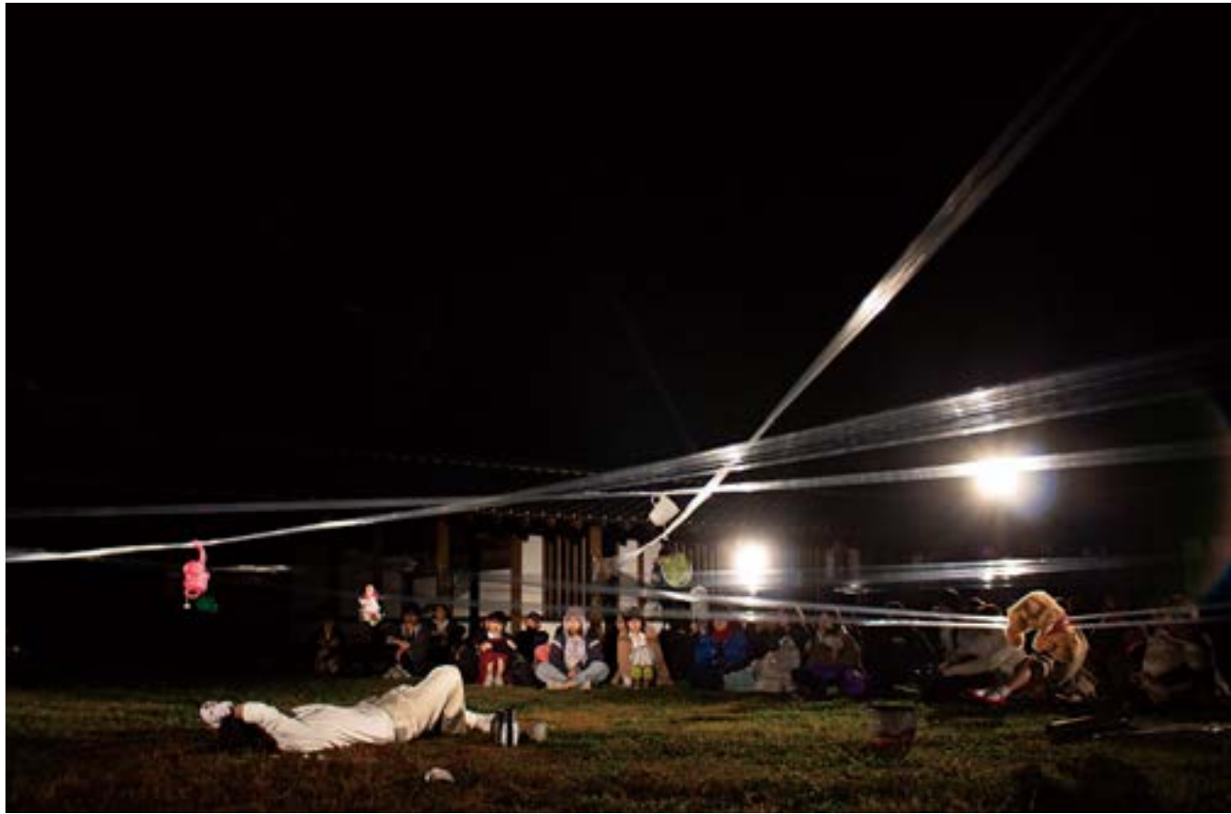
《うつろ》より モチーフを吊るし終え、寝転んでいる。

自らが張り巡らせた巣に手をかけ、その一筋を切り裂いた。懇願するように彼は自らの巣を破壊した。それでも音は止まらない。千切れた糸と思い出が地に落ち、巣が廃墟になった時、クマのぬいぐるみだけを掴み取り、彼はその場から逃げ去った。