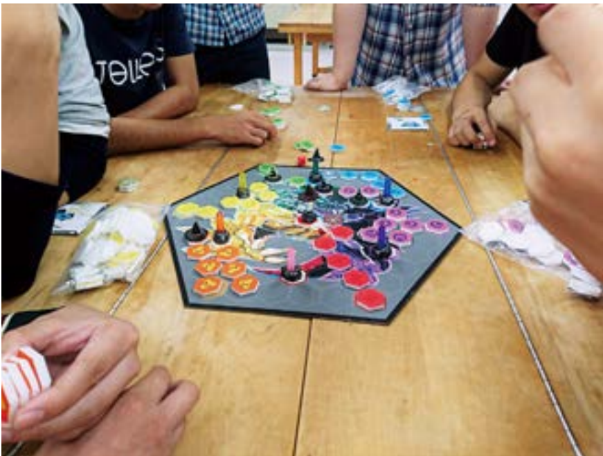
グルコラブプロジェクト《封竜の魔法使い》（2018）

通じて発信したりもできる。何気なく見過ごしてしまいがちな日々の風景に、新しい視点を提案してくれる作品だ。